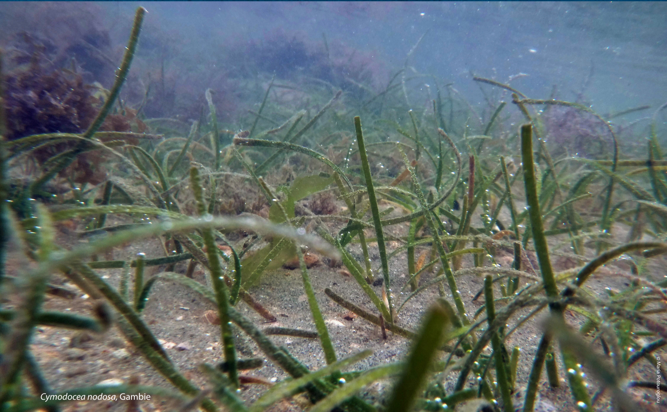
Cymodocea nodosa , Gambie