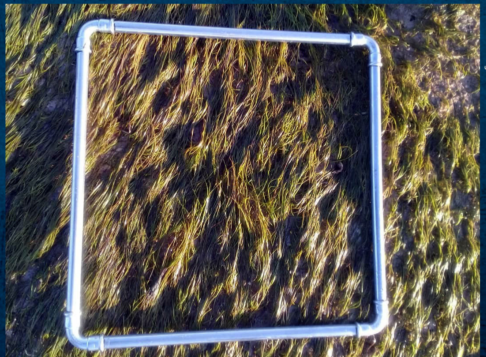
Zostera noltii, Sénégal