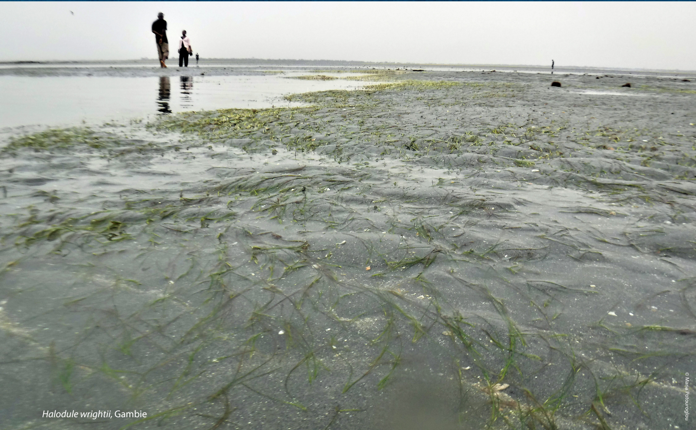
Halodule wrightii, Gambie