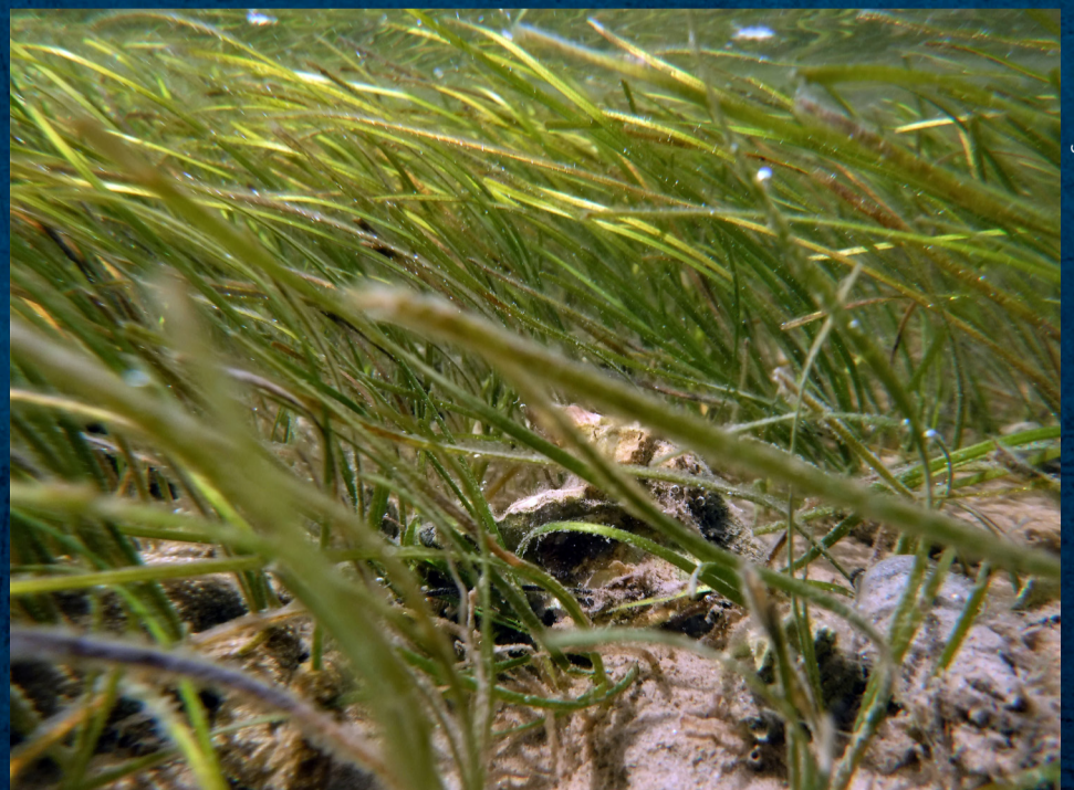
Cymodocea nodosa , Sénégal