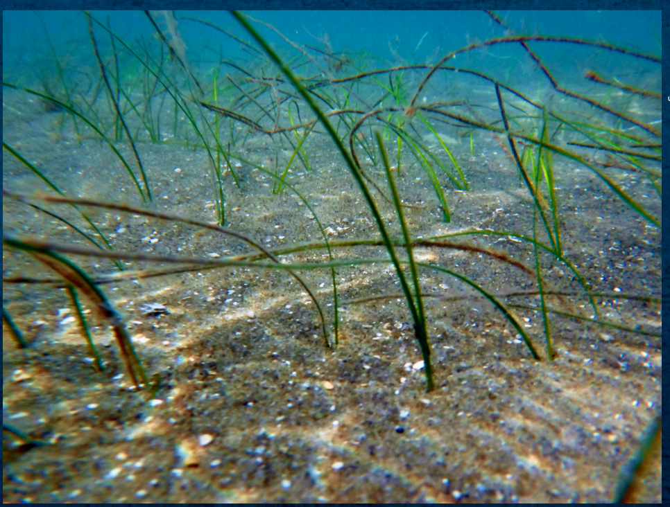
Halodule wrightii, Sierra Leone