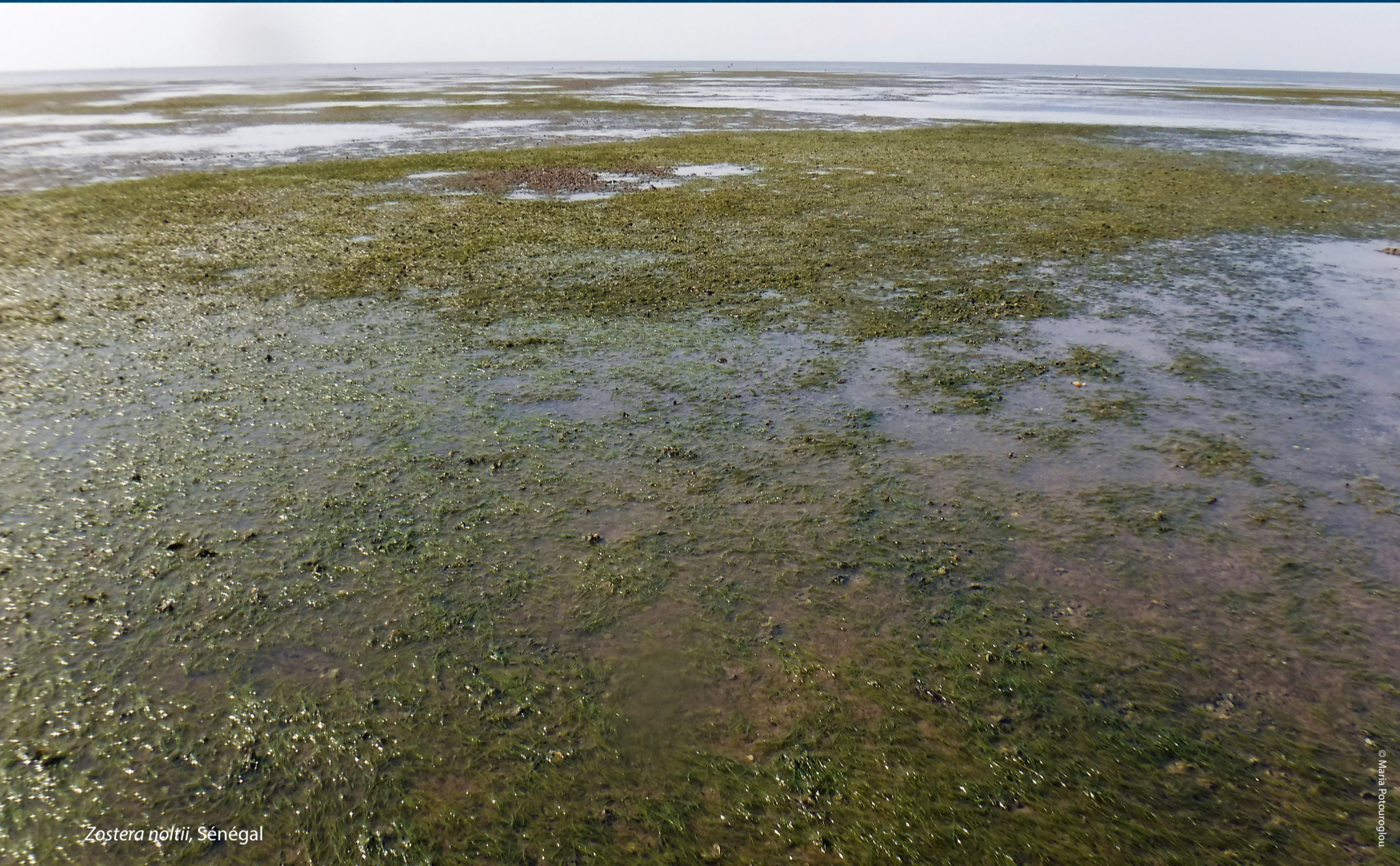
Zostera noltii, Sénégal